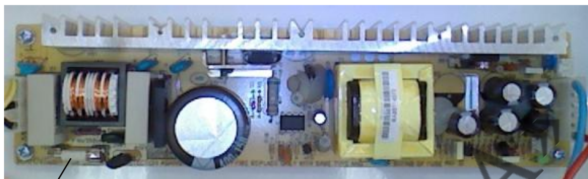
Вставка плавкая ВП2Б-1В 4 А/ 250 В