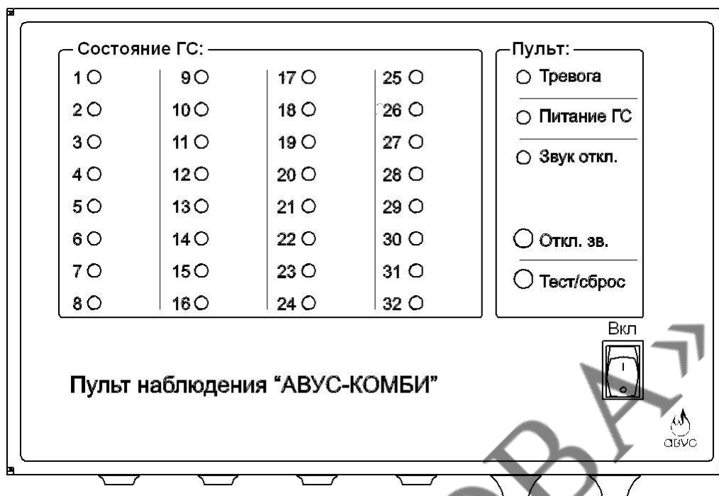
Рисунок 1 – Вид на переднюю панель ПН.

1.3.2 ПН функционирует в круглосуточном режиме и обеспечивает связь с ГС по интерфейсу RS-485 при длине соединительного кабеля до 900 м. При питании ГС от ПН максимальная длина соединительного кабеля зависит от сечения проводников питания, и составляет 30 метров при использовании проводников, сечением 0,6 мм 2 . К ПН можно подключить до 32 ГС. ПН оснащен звуковой сигнализацией. Отображение состояния ГС осуществляется с помощью адресных световых индикаторов и обобщенных световых индикаторов. Предусмотрена связь с ПЭВМ.